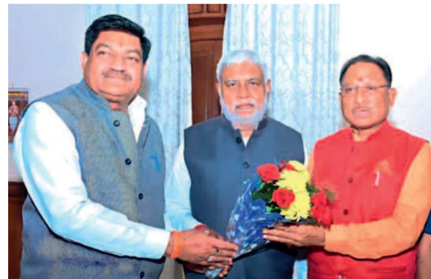
भिलाई। प्रदेश के पूर्व कैबिनेट मंत्री प्रेमप्रकाश पाण्डेय ने प्रदेश के मुख्यमंत्री विष्णुदेव साय से सौजन्य भेंटकर उन्हें नववर्ष की शुभकामनाएं दी। भेंट के दौरान श्री पाण्डेय ने विभिन्न विषयों पर सार्थक चर्चा की।